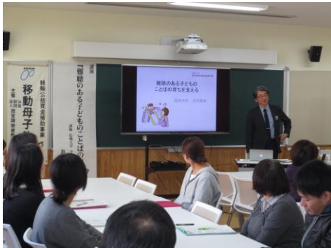
<鹿児島市における移動母子教室>

年度当初に全国聾学校・聴覚支援学校、難聴通園施設等に事業案内を送付し、学校長、園長からの開催希望申込を受け、調整の上、開催を決定している。